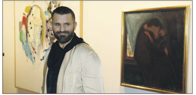
KUNSTNEREN: Bjarne Melgaard fotografert i forbindelse med utstillingen Melgaard Munch for noen år siden.

Det var opprinnelig lagt ut 1122 kunstverk til salgs, men det ble tidlig klart at salget skulle stoppe natt til 24. januar. Til slutt ble det solgt 1025 NFT-verk. De resterende verkene ble «brent», det vil si slettet, fremgår det av en melding. NTB