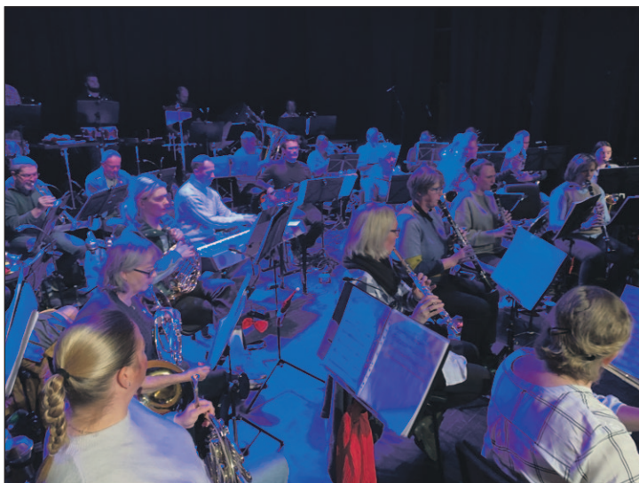
ØVER: Nå øves og øves det i Brevik musikkorps.

- Jeg nærmer meg pensjonsalder. Jeg vet ikke hvordan det blir, jeg slutter nok med noe. Men jeg må også ha noe å drive med, sier han.