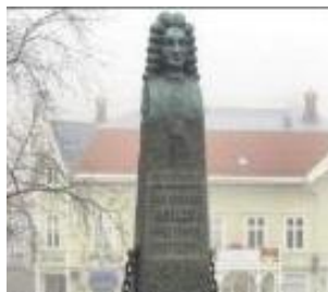
HONORÉ : Statue de Cort Adeler à Brevik, sa ville natale

– Cort Adeler s'est distingué à la fois comme un habile guerrier et comme marin. C'était un bon navigateur et les amiraux vénitiens utilisèrent souvent son navire comme vaisseau amiral, raconte-t-il.