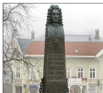
HEIDRA: Statue av Cort Adeler i heimbyen Brevik.

- Cort Adeler utmerka seg, både som ein dyktig krigar og som sjømann. Han var god til å navigera, og dei venezianske admiralane nytta ofte skipet