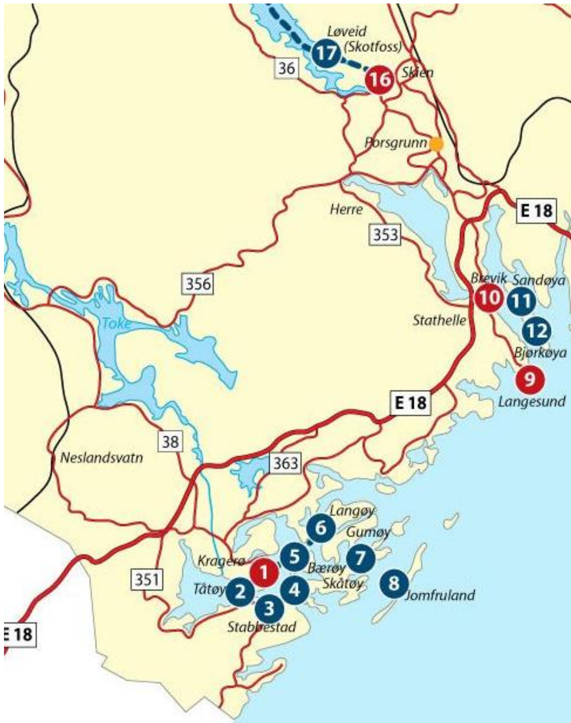
Brevik est marqué 10 et Skien 16

Cela montre clairement que 75 ans avant la naissance de notre héros il y avait une importante activité maritime hollandaise et en partie écossaise. Il ne fait donc aucun doute qu'il y a eu énormément de bateaux et beaucoup d'exportations, et bien sûr aussi d'importations, dans cette région pendant plusieurs centaines d'années. Il n'est donc pas étonnant que notre héros fasse partie d'une partie du milieu hollandais.