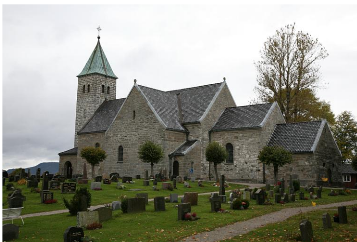
Eglise de Gjerpen à Skien

La propriété comprenait le doyenné de Gjerpen (prostigods) et les biens de l'église de Gjerpen (kirkegods).