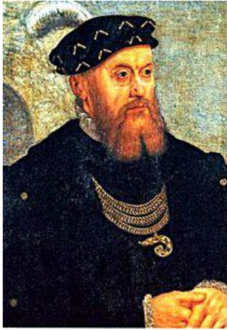
Chrétien III (1503-1534-1559)